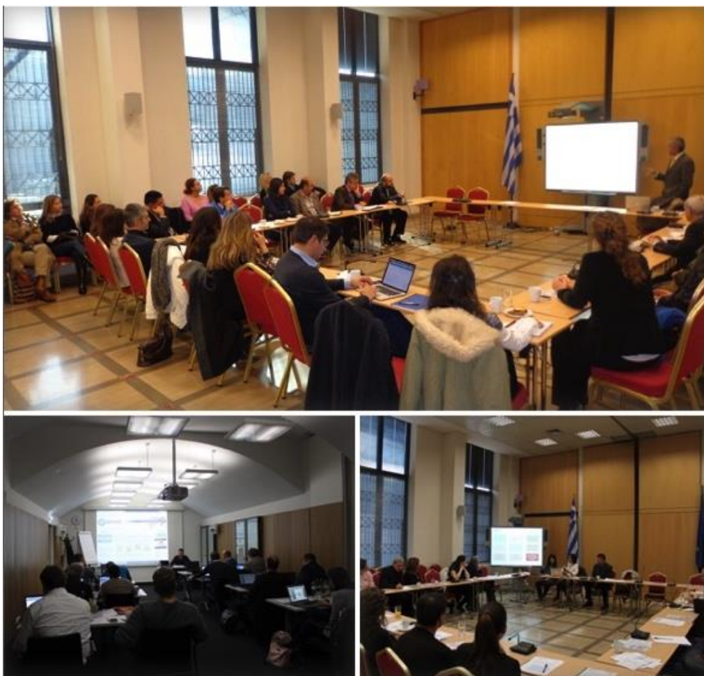
Παρουσίαση του NOMAD στο Ελληνικό και Αυστριακό Κοινοβούλιο

Η μεθοδολογία και τα εργαλεία του NOMAD, που αυτή τη στιγμή βρίσκονται στη φάση ολοκλήρωσης των, παρουσιάστηκαν και αξιολογήθηκαν σε τρεις διαδοχικές συναντήσεις, οι οποίες έλαβαν χώρα στο Ελληνικό και στο Αυστριακό Κοινοβούλιο (12, 18 και 25 Νοεμβρίου). Στις συναντήσεις αυτές συμμετείχαν συνολικά 60 άτομα, ανάμεσα τους κοινοβουλευτικά στελέχη, επιστημονικοί συνεργάτες βουλευτών και κομμάτων, δημοσιογράφοι, μέλη ΜΚΟ, σύμβουλοι επιχειρήσεων. Σημαντική ήταν η εκπροσώπηση του Ελληνικού δημόσιου τομέα, αφού παρευρέθηκαν φορείς όπως η Γενική Γραμματεία της Κυβέρνησης , η Γενική Γραμματεία Συντονισμού του Κυβερνητικού Έργου , 5 Υπουργεία ( Διοικητικής Μεταρρύθμισης , Αγροτικής Ανάπτυξης , Παιδείας , Δημόσιας Τάξης , Ναυτιλίας ), η Γενική Γραμματεία του Ελληνικού Κοινοβουλίου , ο Δήμος Αθηναίων , η συνεισφορά των οποίων ήταν η σημαντική στη συζήτηση για την υιοθέτηση και αξιοποίηση εργαλείων πληροφορικής όπως το NOMAD, στις καθιερωμένες διαδικασίες τους.