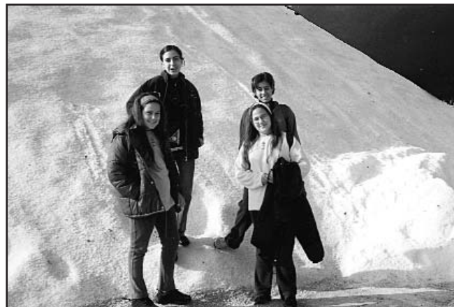
Από άλλες δραστηριότητες του προγράμματος, Αλυκή Καλλονής

Η μεγαλύτερη κατανάλωση γίνεται από άτομα μεγαλύτερης ηλικίας, οι νεότερες ηλικίες προτιμούν το φιλέτο. Τα πα-