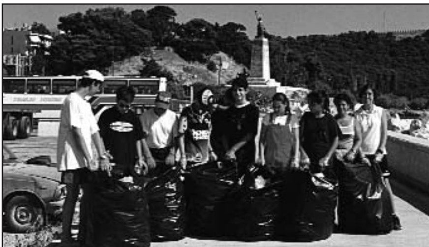
Καινοτόμος Δράση στην πράξη. Θέμα: Διαχείριση απορριμμάτων