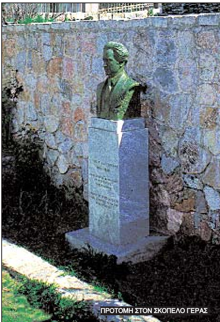
ΠΡΟΤΟΜΗ ΣΤΟΝ ΣΚΟΠΕΛΟ ΓΕΡΑΣ