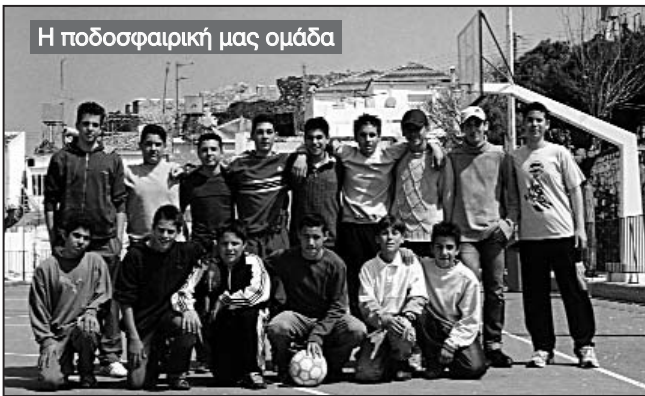
Η ποδοσφαιρική μας ομάδα

Πρώτος αντίπαλος του Γυμνασίου μας ήταν η ομάδα του Γυμνασίου Παμφίλων, την οποία νικήσαμε 3 - 1. Το σκορ άνοιξε