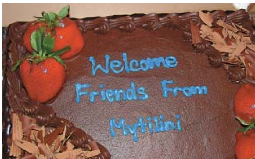
Κάθε σπίτι και μία γλυκειά υποδοχή! Στο τέλος καποιοι φίλοι μας δάκρυσαν από το παράπονο γιατί να μην προλάβουν και εκείνοι να μας φιλοξενήσουν έστω για λίγο.