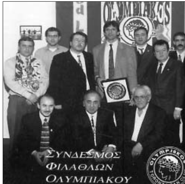
Μέλη των «Συνδέσμου Φιλάθλων Ολυμπιακού» στο Τορόντο.

Παροικιακή οργάνωση των Ελληνοκαναδών αρχίζει στις αρχές του εικοστού αιώνα, όταν συγκεντρώθηκε ένας σημαντικός αριθμός στις μεγάλες πόλεις του Καναδά και κυρίως στο Μόντρεαλ και το Τορόντο. Όταν μιλούμε για παροικιακή οργάνωση αναφερόμαστε στην ίδρυση, από τους πρώτους μετανάστες,