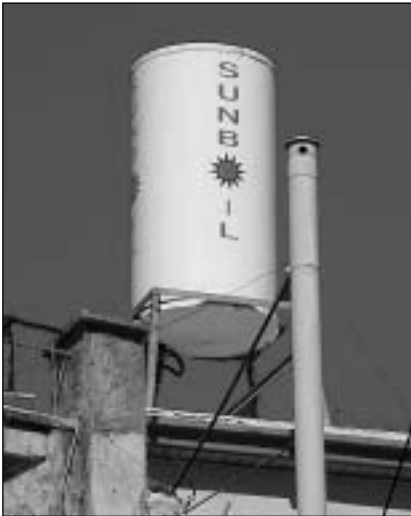
Κεραία “μεταμφιεσμένη” σε ...θερμοσίφωνα, όπως λέει η εταιρεία «για λόγους αισθητικής».

Τ η συναντάμε παντού. Είναι η ακτινοβολία που στις μέρες μας έχει μπει για τα καλά στη ζωή μας. Στις τηλεοράσεις, στο τηλέφωνο (κινητό και ασύρματο σταθερού), στο ραδιόφωνο (πομπό σταθμού), στον υπολογιστή, στο φούρνο μικροκυμάτων καθώς και σε άλλες πολλές συσκευές που συναντάμε και χρησιμοποιούμε κάθε μέρα. Ακτινοβολία εκπέμπει και ο ήλιος.