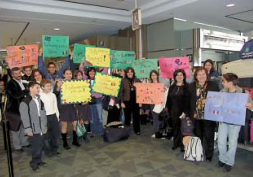
“Καλοσωρίσατε φίλοι μας” Η Υποδοχή του Πειραματικού Γυμνασίου από τους αδελφούς μας ομογενείς στο αεροδρόμιο του Τορόντο.