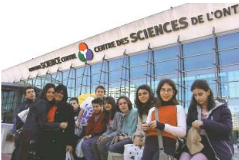
Αμέτρητες οι εκπλήξεις που μας είχαν προετοιμάσει οι φίλοι μας στην ομορφότερη, όπως λέγεται, πόλη της Βορείου Αμερικής. Εδώ, έξω από το εκπληκτικό Science Centre.

Όλη η ομογένεια του Τορόντο στο πόδι για να μην μας λείψει τίποτα. Πολλές οι αναφορές στις στον τοπικό ελληνικό τύπο αλλά και στην τηλεόραση με ειδήσεις, στιγμιότυπα απο την επίσκεψή μας και τις εκδηλώσεις μας. Εδώ, στιγμιότυπο από εκπομπή που έγινε στο κανάλι OMNI.