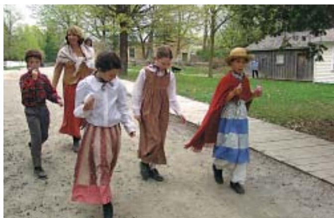
Μαθητές στο παραδοσιακό χωριό Black Creek, όπου αναβιώνεται η ζωή των πρώτων μεταναστών.