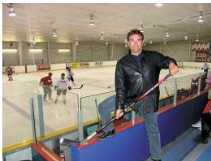
Ακόμα και μαθήματα Hockey φρόντισαν να μας κάνουν οι φίλοι μας στον Καναδά. Κάποιοι μάλιστα φαίνεται να απέκτησαν το στυλ ... παικταρά.