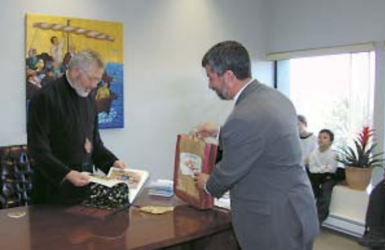
Υποδοχή από τον Αρχιεπίσκοπο Καναδά κ.κ. Σωτήριο και ανταλλαγή δώρων.