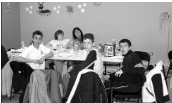
Δοκιμάζοντας γευστικούς μεζέδες του Χιώτη μάγειρα του σχολείου της «Μεταμόρφωσης».

τητα η φιλοξενία ήταν ιερή και οι αρχαίοι Έλληνες έδιναν στους φιλοξενούμενους ό,τι καλύτερο είχαν για να κάνουν τη διαμονή τους όσο το δυνατόν πιο τέλεια. Οι Έλληνες λοιπόν του Τορόντο φάνηκαν αντάξιοι των προγόνων τους και δεν θα ήταν υπερβολή αν έλεγα ότι τους ξεπέρασαν σε ευγένεια, γενναιοδωρία και απλόχερη καλοσύνη.