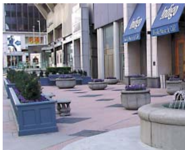
Εντυπωσιακή η εσωτερική και εξωτερική διακόσμηση των καταστημάτων. Λουλούδια αντί για τεράστιες επιγραφές και ... πραμμάτιες.

Όλη η ομογένεια του Τορόντο στο πόδι για να μην μας λείψει τίποτα. Πολλές οι αναφορές στις στον τοπικό ελληνικό τύπο αλλά και στην τηλεόραση με ειδήσεις, στιγμιότυπα απο την επίσκεψή μας και τις εκδηλώσεις μας. Εδώ, στιγμιότυπο από εκπομπή που έγινε στο κανάλι OMNI.