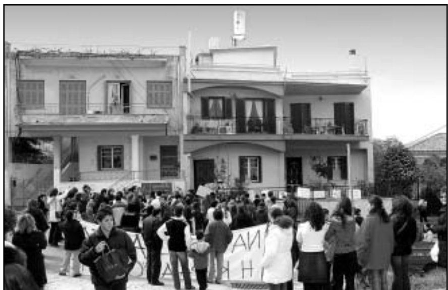
Οι μαθητές του Σχολείου μας μαζί με μαθητές του 5ου Δημοτικού Σχολείου, γονείς και περιοίκους, στο χώρο κεραίας κινητής τηλεφωνίας, συνεχίζουν να δηλώνουν την αντίθεσή τους στη συνέχιση λειτουργίας,

Με τη φράση αυτή εννοώ μεθόδους προστασίας από τη μεγάλη ακτινοβολία. Τέτοιες είναι κάποιες συσκευές όπως τα hands free και τα Bluetooth. Με τη χρήση αυτών το κεφάλι μας δεν έρχεται σε άμεση επαφή με τη συσκευή του κινητού, επομένως, δεν δέχεται μεγάλες ποσότητες ακτινοβολίας. Σε περίπτωση, λοιπόν, που το κινητό μας δεν έχει (δυνατό) σήμα, είναι καλύτερο να χρησιμοποιούμε μια τέτοια συσκευή (Hands free ή Bluetooth)!