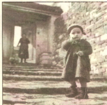
Μικρή Σαρακατσάνα στο Πάπιγχο Ηπείρου

Η ΗΠΕΙΡΟΣ είναι ίσως η περιοχή της Ελλάδας, με την πλουσιότερη μουσικοχορευτική παράδοση. Οι χοροί της, επηρεασμένοι από την ορεινή μορφολογία του εδάφους και το ψυχρό κλίμα, είναι αργοί, δυναμικοί και μεγαλοπρεπείς. Παλιότερα χορεύονταν κυρίως σε ανοιχτό κύκλο, όπου άντρες και γυναίκες τοποθετούνταν σε ξεχωριστούς ομόκεντρους κύκλους. Συνήθως οι γυναίκες τοποθετούνταν στον εσωτερικό κύκλο και οι άντρες στον εξωτερικό, σαν ένα σύμβολο προστασίας. Εκτός από τους κυκλικούς χορούς συναντάμε και ζευγαρωτούς αντικριστούς χορούς. Το κυριότερο μουσικό όργανο στη μουσικοχορευτική παράδοση της Ηπείρου είναι το κλαρίνο.