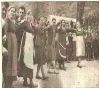
Γλέντι στους Προμάχους (Αριδαίας)

Η ΕΠΑΡΧΙΑ ΑΛΜΩΠΙΑΣ κατέχει το Βόρειο τμήμα του νομού Πέλλας (περιοχή Αριδαίας), και ήταν μια από τις 17 επαρχίες του αρχαίου Μακεδονικού Βασιλείου. Η μυθολογικοί της κάτοικοι, οι Άλμωπες - φυλή γιγάντων -, πήραν το όνομά τους από τον αρχηγό τους, Άλμωπα, γιο του Ποσειδώνα και της Έλλης. Τα κύρια μουσικά όργανα που έπαιζαν οι λαϊκοί οργανοπαίχτες στην περιοχή, πριν τον 1ο Παγκόσμιο Πόλεμο, ήταν γκάνιντες, ταμπουράδες, καβάλια, φλογέρες και νταούλια, με τη συνοδεία τραγουδιού, στο «ντόπιο» γλωσσικό ιδίωμα. Μετά την απελευθέρωση (1912), αλλά κυρίως κατά τη διάρκεια του μεσοπολέμου, σταδιακά αλλάζουν τα όργανα με πρώτο το κλαρίνο κι έπειτα τα χάλκινα (χορνέτα και τρομπόνι). Τέλος, εγκαταλείπονται τα συνοδευτικά τραγούδια στο «ντόπιο» γλωσσικό ιδίωμα (1930-40). Έτσι αναδιαμορφώνεται το μουσικοχορευτικό ύφος ενώ οι χορευτές αυτοσχεδιάζουν, για να καλύψουν την απουσία του στίχου, δίνοντας νέα ορμητικότητα και ένταση στο χορευτικό ύφος.