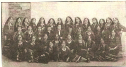
Αρραβωνιασμένες κοπέλες στις Καρούς Ανατολικής Ρωμυλλίας