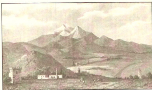
Τοπίο στην Καππαδοκία

Η ΚΑΠΠΑΔΟΚΙΑ βρίσκεται στο κέντρο της Μ. Ασίας, όπου η Ελληνική γλώσσα άρχισε να μιλιέται από την εποχή των διαδόχων του Μ. Αλεξάνδρου. Η προσπάθεια των κατοίκων της, στους αιώνες της Τουρκοκρατίας, να διατηρήσουν την ταυτότητα τους, μέσα σε τόσες διαφορετικές φυλές και παρά τις δύσκολες συνθήκες δε θα μπορούσε να μην επηρεάσει τη μουσικοχορευτική παρά-