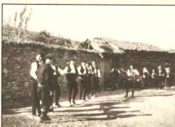
Παραδοσιακό γλέντι στη Θράκη