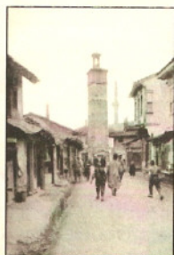
Παζάρι στη Φλώρινα - Κεντρικός δρόμος στη Φλώρινα