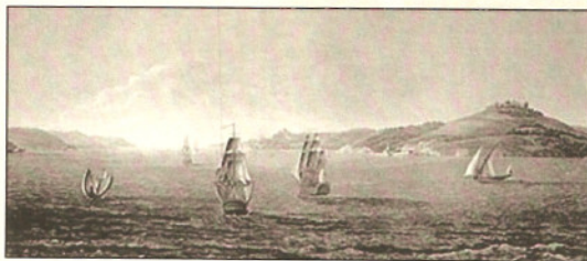
Πλοία στον Εύξεινο Πόντο, πλησιάζοντας στα στενά του Βοσπόρου

Ο Ι ΑΚΤΕΣ ΤΗΣ ΜΑΥΡΗΣ ΘΑΛΑΣΣΑΣ, στη γη των αρχαίων Θρακών, αποικήθηκαν από Έλληνες Μιλήσιους και Μεγαρείς τον 7ο π.Χ. αιώνα. Οι πρώτοι ελληνικοί οικισμοί που δημιουργούνται, είναι οι λεγόμενες 'εμπορίες' (εμπορικοί σταθμοί) οι οποίες αργότερα διαμορφώθηκαν σε πόλεις (Απολλωνία, Μεσημβρία, Οδησσός, Αγκίαλος κ.α.). Στην περιοχή κατοικούσαν πολλές χιλιάδες ελληνικές οικογένειες, μέχρι τις αρχές του 20ου αιώνα οπότε αναγκάστηκαν να εγκαταλείψουν τον τόπο τους μεταφέροντας την παράδοση και τον πολιτισμό τους στη Μητέρα Ελλάδα. Οι Μαυροθαλασσίτικοι χοροί είναι ζωνροί, γρήγοροι και τρανταχτοί. Τα κύρια μουσικά όργανα της περιοχής ήταν η γκάιντα, το καβάλι, το ακορντεόν (μεταγενέστερο) και τα κρουστά (τενεκές και έπειτα νταούλι).